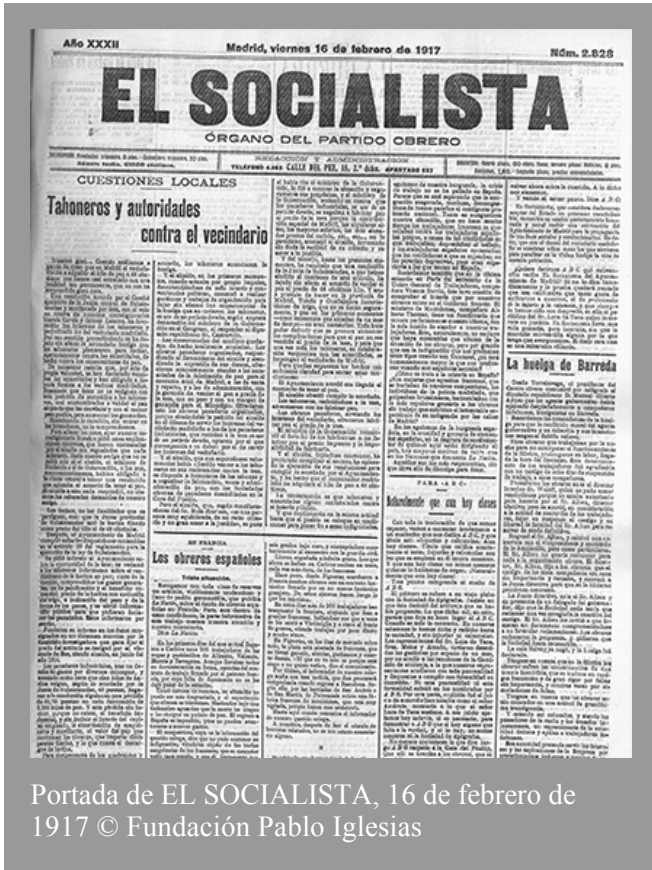
Portada de EL SOCIALISTA, 16 de febrero de 1917