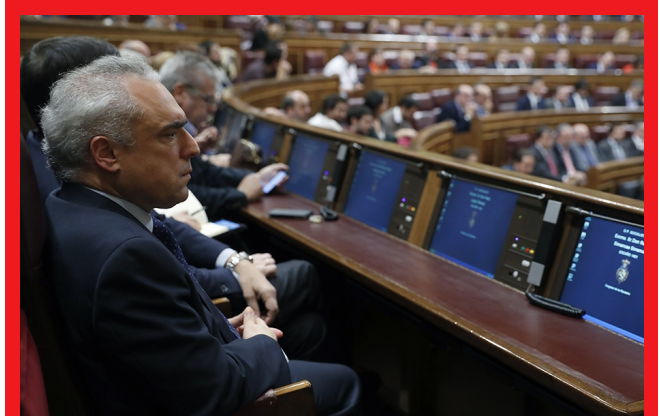
El portavoz socialista de Empleo, Rafael Simancas, en la sesión de control al Gobierno

El portavoz socialista de Empleo, Rafael Simancas, subrayó ayer que "no habrá ningún tipo de diálogo social con expectativa de éxito que no lleve a la derogación de la reforma laboral y a la recuperación de los derechos de los trabajadores". En la sesión de control al Gobierno, Simancas le ha advertido a la ministra de Empleo, Fátima Báñez, que si "se encastilla en la defensa del trabajo precario y en el recorte de los derechos de los