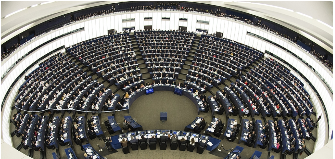
Vista general del hemiciclo del Parlamento Europeo (PE) durante la votación del CETA