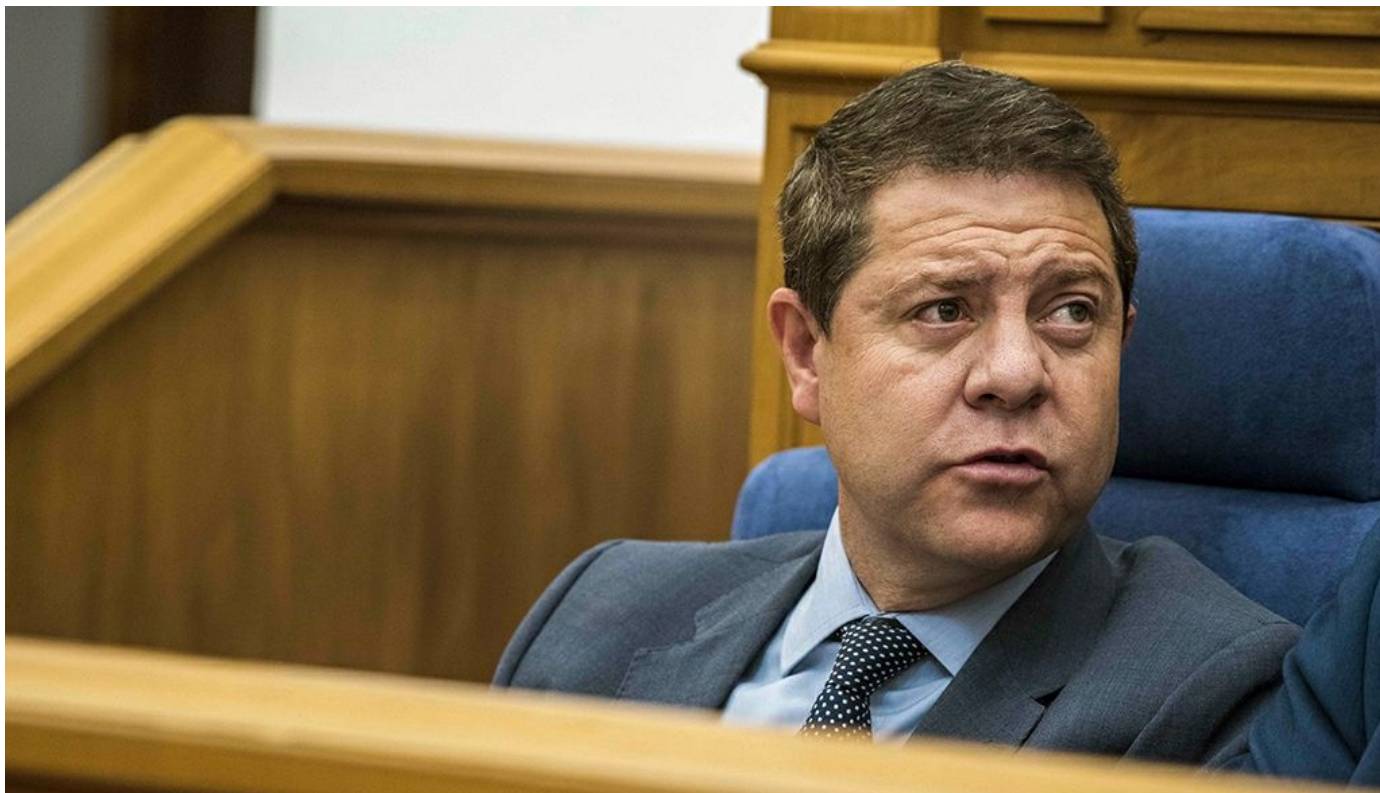
El presidente de la Junta de Castilla-La Mancha, Emiliano García-Page