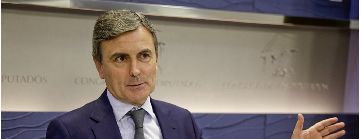
El portavoz de Economía Pedro Saura