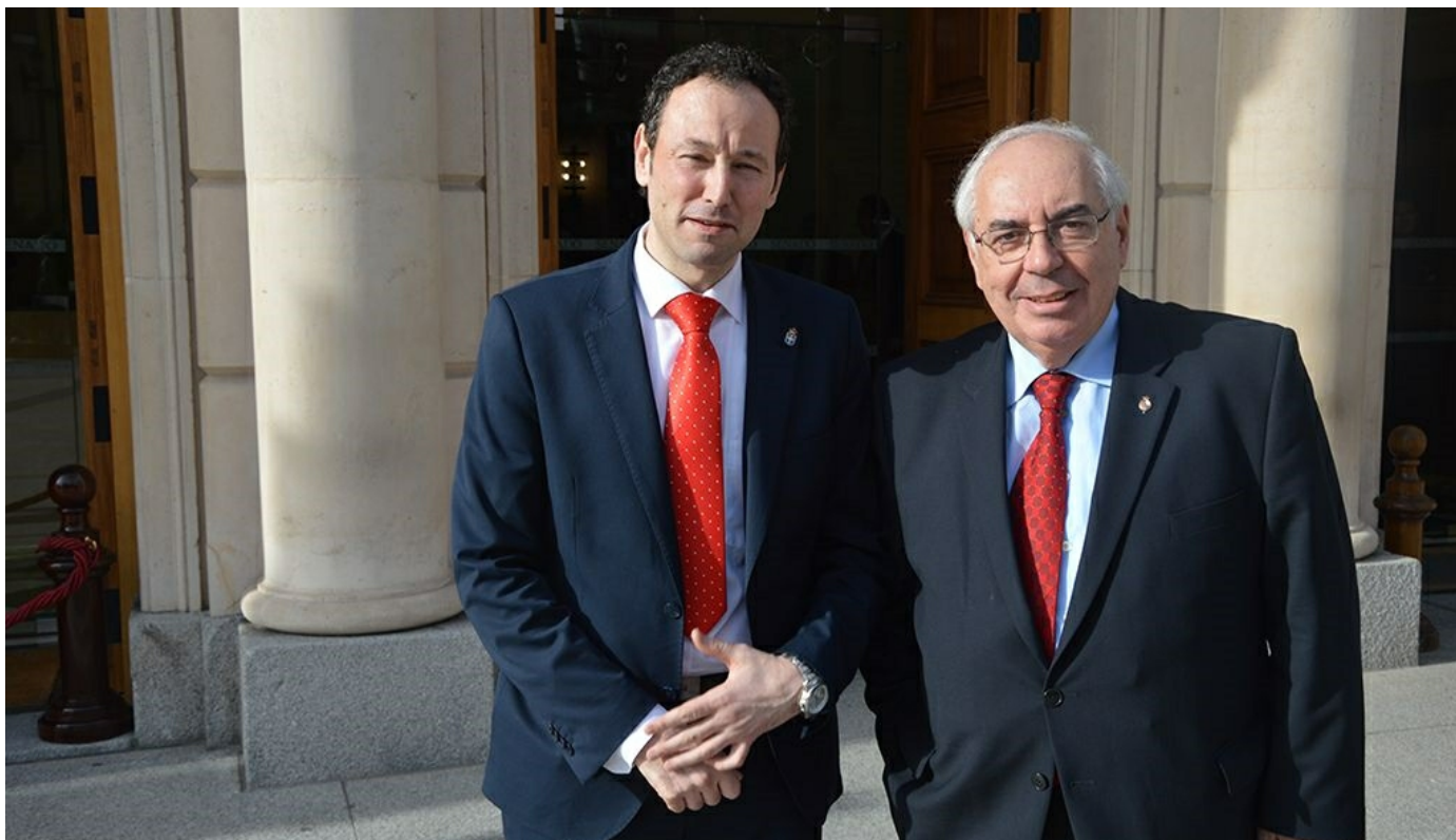
El portavoz del grupo socialista en el Senado, Vicente Álvarez Areces

El portavoz del PSOE en el Senado, Vicente Álvarez Areces, cree que el Senado debe jugar un papel imprescindible en el desarrollo de los grandes acuerdos políticos que van a ser necesarios en esta legislatura.