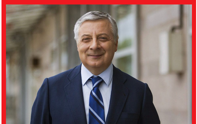
El eurodiputado socialista José Blanco

El eurodiputado socialista José Blanco ha trasladado al vicepresidente para la Unión de la Energía, Maros Sefcovic, y al comisario de Acción por el Clima y Energía, Miguel Arias Cañete, la necesidad de alcanzar objetivos más ambiciosos en la reforma de la directiva de energía renovables, de la que es ponente parlamentario. En un encuentro ayer tarde en el Parlamento europeo en Estrasburgo con